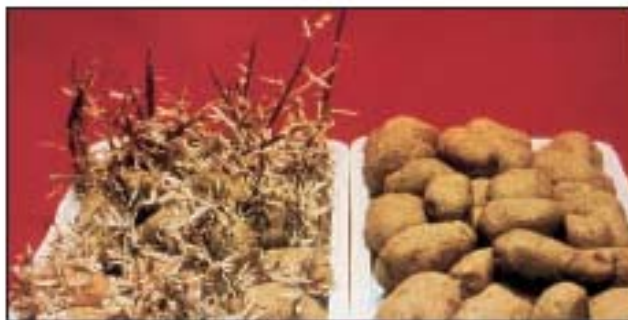
Rys. 1. Porównanie grupy ziemniaków nienapromieniowanych i napromieniowanych dawką około 200 Gy, po długim czasie przechowywania ich w tych samych warunkach

Procesy konserwowania, pasteryzacji i sterylizacji żywności za pomocą obróbki termicznej czy też dodawanie środków chemicznych związane są ze zmianą smaku, zapachu, koloru i innych właściwości organoleptycznych. Promieniowanie jądrowe może także wywołać takie zmiany, ale występują one w znacznie mniejszym stopniu i tylko w przypadku niektórych artykułów (np. mleka i masła). W większości przypadków zmiany takie występują przy dawkach napromieniowania znacznie większych niż konieczne do sterylizacji.